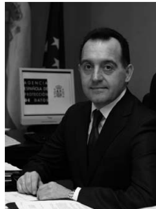
ARTEMI RALLO LOMBARTE DIRECTOR DE LA AGENCIA ESPAÑOLA DE PROTECCIÓN DE DATOS

Desde este momento, las autoridades de supervisión y control de la privacidad asumimos la exigente tarea de difusión y promoción desde nuestro firme compromiso de garantizar a nuestros ciudadanos una mejor protección de la privacidad y de los datos de carácter personal.